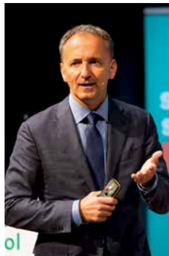
Jim Hagemann Snabe 西门子董事长