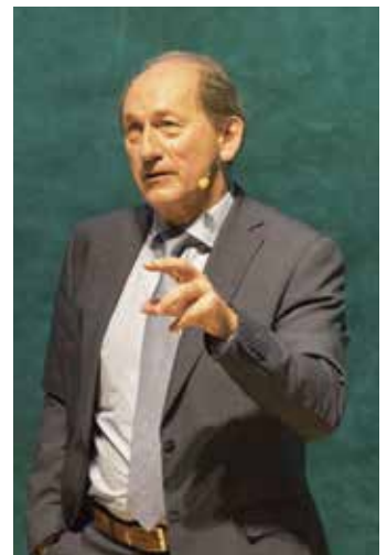
Paul Bulcke 雀巢董事长