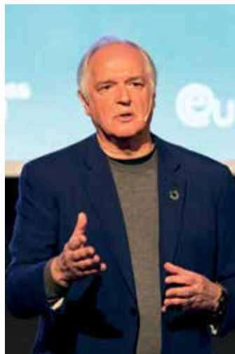
Paul Polman 联合利华 CEO (2009-2019) Net Positive一书联合作者