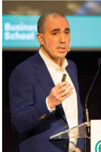
عمر برادة الرئيس التنفيذي لعمليات كرة القدم في مجموعة سيتي لكرة القدم (Manchester City FC) وخريج الإتحاد الأوروبي