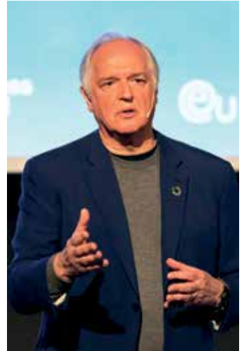
بول بولمان الرئيس التنفيذي لشركة بونيليفر (2009-2019) ومؤلف مشارك في Net Positive